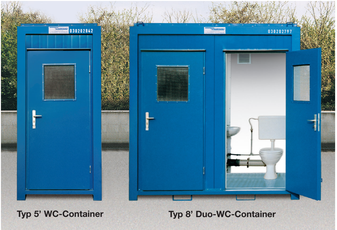
Typ 5' WC-Container