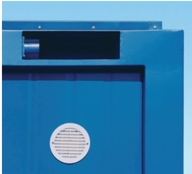
CEE-Anschluss im Rahmen versenkt