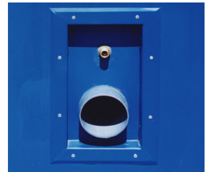
Wasseranschluss in der Wand versenkt