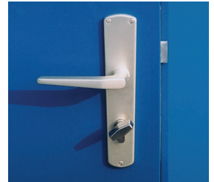
Türschnalle mit Drehgriff